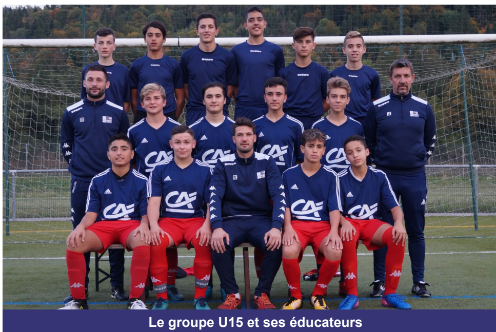
Le groupe U15 et ses éducateurs