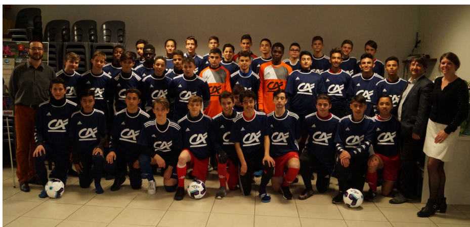
Les U15, U17 et U19 lors de la remise des maillots Crédit Agricole

Dernière minute : les U17 et les U19 se sont qualifiés pour les ½ finales en gagnant respectivement 3 à 1 et 5 à 1. En ½ finale, les U17 et les U19 accueilleront Pontarlier.