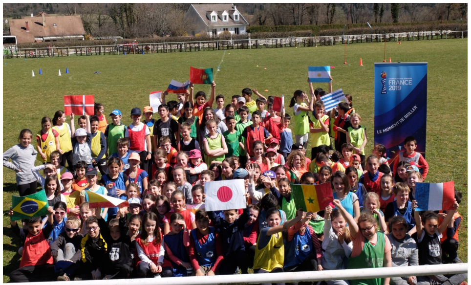
Belle journée de fin de cycle foot dans les écoles primaires